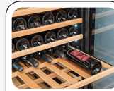
Ausziehbare Einschübe aus Holz