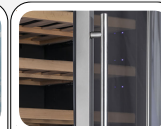
Zylindrischer Türgriff (Edelstahltürgriff)