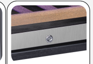
Türschloß als Standard