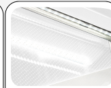
Innere LED Beleuchtung