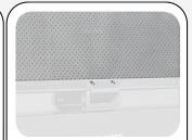
Nachttrollo (Stofffarbe grau)