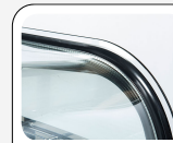
Gebogenes Seiten- und Frontglas