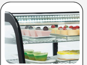
Innere LED Beleuchtung