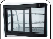
Schiebetüren auf der Rückseite