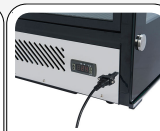
Edelstahlkorpus mit digitalem Thermostat