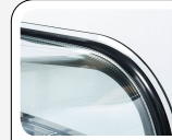
Gebogenes Seiten- und Frontglas