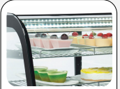
Innere LED Beleuchtung