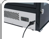
Edelstahlkorpus mit digitalem Thermostat