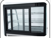
Schiebetüren auf der Rückseite