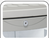
Türschloß als Standard