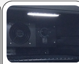
Interne LED Beleuchtung