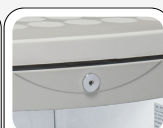
Türschloß als Standard