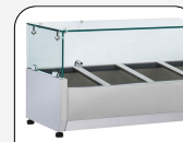
Top aus Sicherheitsglas