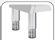
Höhenverstellbare Edelstahlfüße optional verfügbar