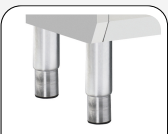
Höhenverstellbare Edelstahlfüße optional verfügbar